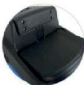
Sistema de detección de presión en el asiento para evitar tocar falsamente el pedal de manejo, lo que podría crear un accidente.

El motor de tracción de 300w proporciona la capacidad de escalada hasta el 20%.