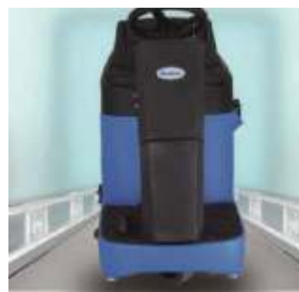
El diseño compacto se puede utilizar incluso en las áreas más congestionadas y los pasajes más estrechos.